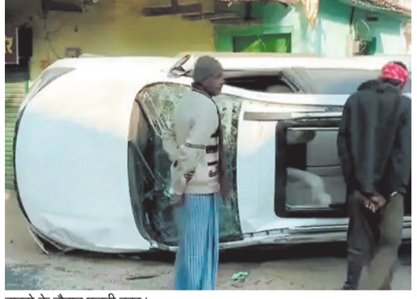
हादसे के दौरान पलटी कार।