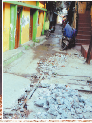
बिछाई गई नई पाइप लाइन।