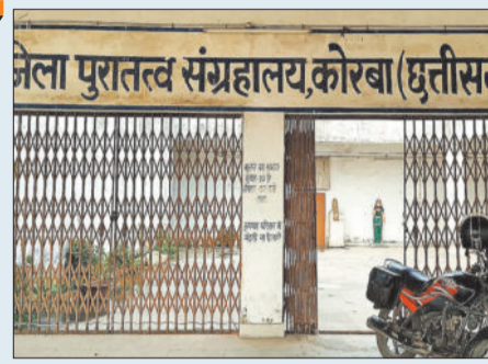
जिला पुरातत्व संग्रहालय, कोरबा (दृष्टीसंग)