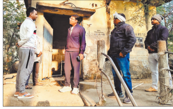
कर्मचारी से जानकारी लेते निगम कमिश्नर।