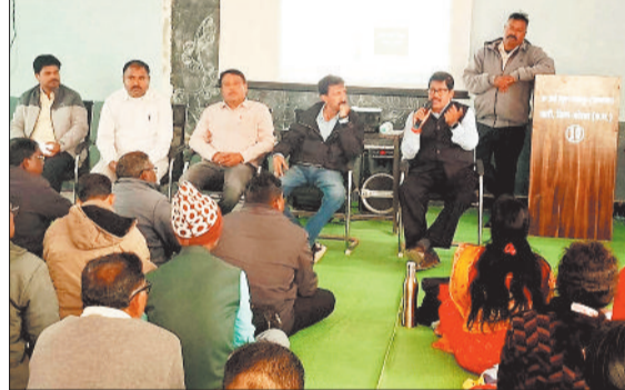
प्रशिक्षण कार्यक्रम में शामिल शिक्षक।