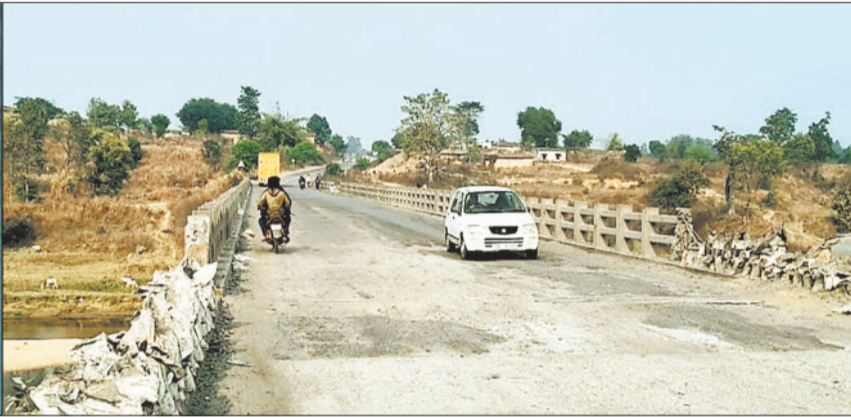
तान नदी पर स्थित जर्जर पुल एवं क्षतिग्रस्त डिवाइडर।