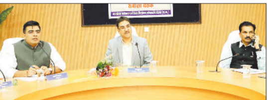
राजनीतिक दलों की बैठक लेते ऑब्जर्वर, संभागायुक्त व कलेक्टर।

आयुक्त व रोल ऑब्जर्वर बिलासपुर संभाग सुनील जैन तथा कलेक्टर एवं जिला निर्वाचन अधिकारी कुणाल दुदावत की उपस्थिति में राजनीतिक दलों की बैठक आयोजित की गई। बैठक में आयुक्त एवं रोल ऑब्जर्वर द्वारा निर्वाचक नामावलियों के विशेष गहन पुनरीक्षण (एसआईआर), अर्हता तिथि 1 जनवरी के संबंध में विस्तृत जानकारी प्रदान की गई। उन्होंने बताया कि भारत निर्वाचन आयोग की स्पष्ट मांश है कि कोई भी पात्र मतदाता का नाम