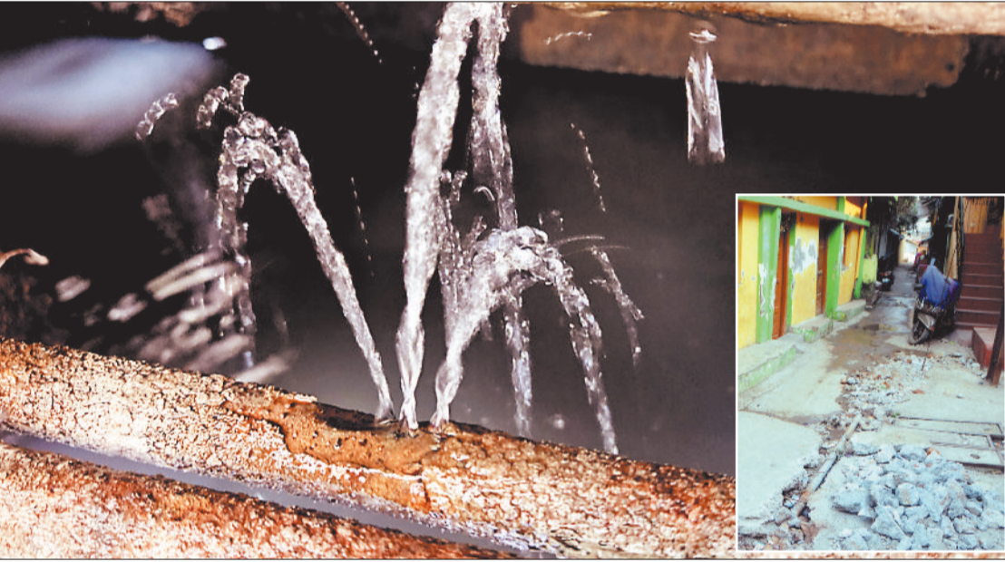
नई लाइन बिछाने के बाद भी नाली के अंदर फूटी पाइप लाइन से हो रही पानी की सप्लाई।

जेपी वर्मा कॉलेज के बगल से मिनी बस्ती का क्षेत्र गुप्त छासीबाद नगर के अंतर्गत आता है। यहां के लोगों का कहना है कि अधिकांश नालियों की पाइप लाइनें नालियों के बीच से गुजरी हैं। बीच में गंदे पानी की शिकायत आने पर जांच करवाया गया था। इसमें दूषित पानी की बात सामने आई थी। वार्ड में अमृत मिशन की सप्लाई के बावजूद लोगों को 9 ट्यूबवेल से सीधी सप्लाई का सहारा ले पड़ रहा है। इसी तरह वार्ड क्रमांक 65 संत नामदेव नगर में भी नालियों के बीच से गुजरी पाइप लाइन से गंदे पानी पहुंच रहा है। हालांकि लगातार शिकायत के बाद नाले-नालियों के बीच से गुजरी पाइप लाइनों को बदलने के निर्देश दिए गए हैं।